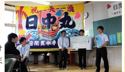
「こんな島をつくりたい！」