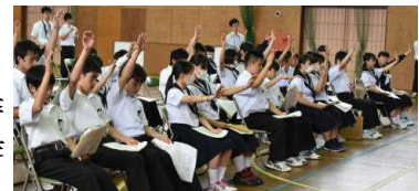
全員で素敵な日中を！