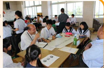
大人と子どもが意見を交わします