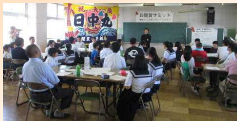
日間賀島の将来を語り合いました

「大人と子どもが協力して島をキレイにする活動を」「島内で働ける仕事をもっと紹介できるとよい」などのアイデアが出されていました。実現するための取組を、今後実践していく予定です。