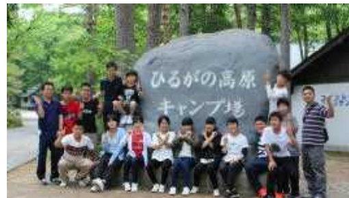
ひるがの高原キャンプ場にて