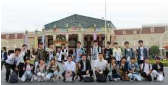
ディズニーランド前にて