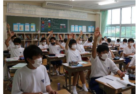
〔1A教室で授業が始まりました！〕

6月15日からは教室での生活になり、教室でのルールや係の仕事などを理解し、自分たちの役割を意識して行動しようとする様子が見られました。また、クラスの級訓やイラスト決め、林間学校の準備など、クラス26人全員で活動することができました。級友との関わりを大切に、新しい友達作りや友達の新しい一面に気付けるようになってほしいと思います。