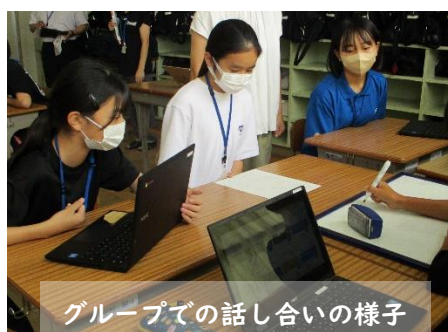
グループでの話し合いの様子