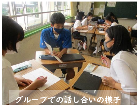
グループでの話し合いの様子