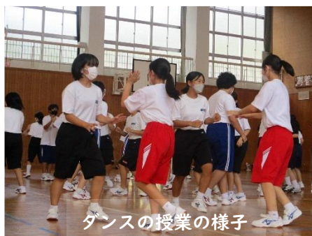
ダンスの授業の様子