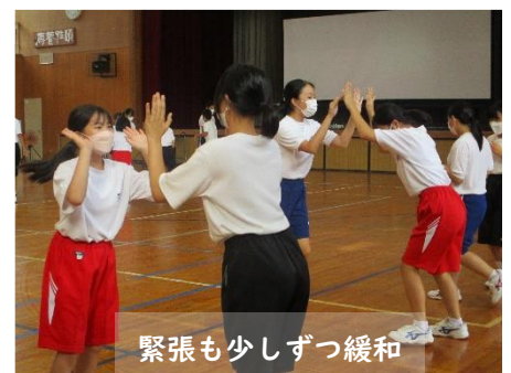
緊張も少しずつ緩和