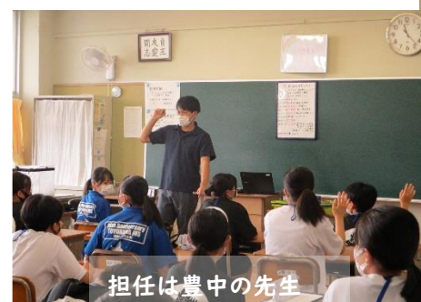
担任は豊中の先生