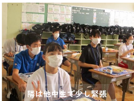
隣は他中生で少し緊張