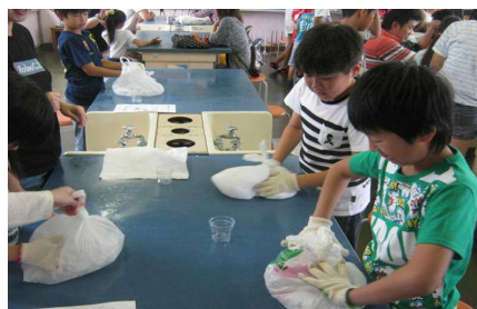
<おもしろ科学実験>