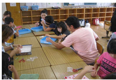
<ビーズアクセサリ>