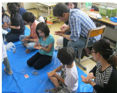
<スーパー土だんご作り>