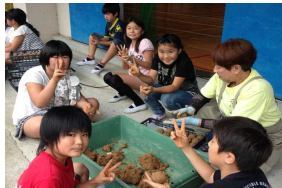
<ふるさと創生の会の方とEMだんご作り>

7月3日(金)、NPO ふるさと創生の会のみなさんが、5年生にEMだんごの作り方を教えてくれました。独特の臭いがありますが、がんばって、1200個のだんごを作り上げました。後日、地域の川に投入し、水をきれいにして、生き物や植物が豊かな環境をつくれます。