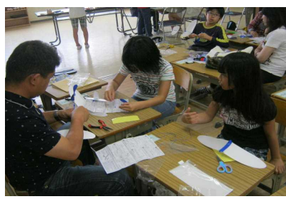
<つくって飛ばそう>