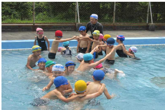
<水泳を楽しむ子どもたち>

6月23日(火)から水泳指導が始まりました。子どもたちは水泳の時間を心待ちにしています。水泳が始まるとプールに歓声があがります。泳力をしっかりつけさせたいと思います。水着や水泳カードなど、水泳の用意を忘れないようにご協力ください。