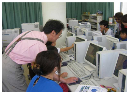
<星座早見盤を作ろう>