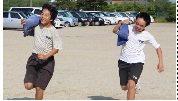
【すごく転ぶ人たち】