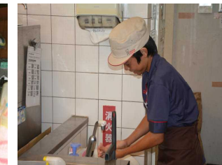
(ミスタードーナツ)