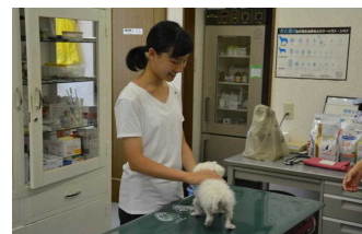
(かみのま動物クリニック)