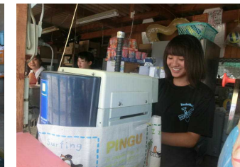
(シーサイドサロン とろぶる)