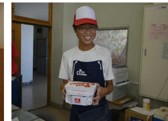
(ピザカリフォルニア)