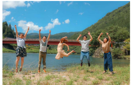
↑職員旅行の写真。跳躍力に注目

今のささやかな目標は、被写体になってくれる人のよさを引き出せるような写真を撮れるようになること。何気ない日常を残せるようになること。誰かが笑顔になるような写真を撮れるようになることです。今週末は、どんな写真を撮ろうか考えるだけで、わくわくしてきます。