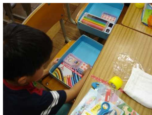
今回のテーマは、道具の整理整頓でした