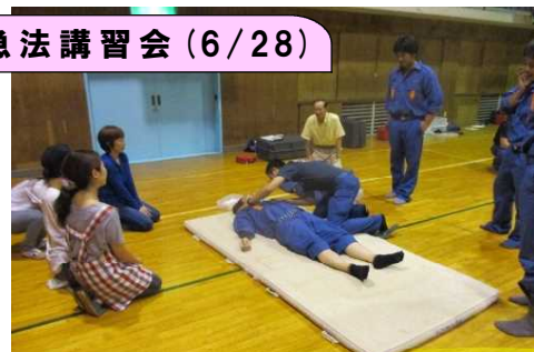
いざとなったら、助けるしかない!