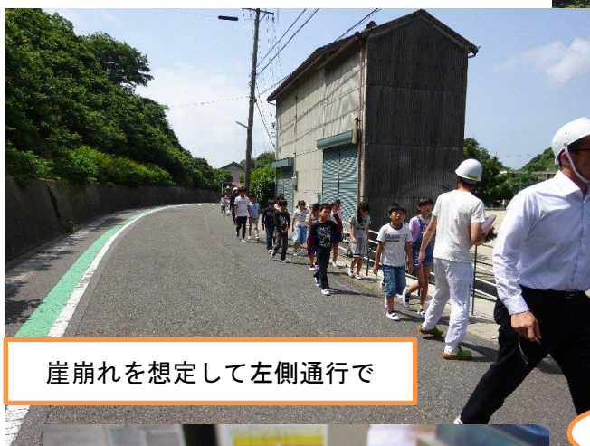
崖崩れを想定して左側通行で