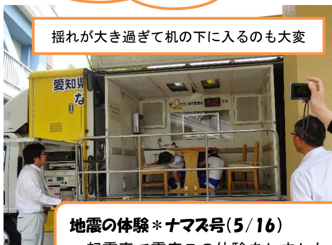
揺れが大き過ぎて机の下に入るのも大変

町防災安全課より「缶入りパン」をいただきました。災害時の非常食です。児童に配布しましたので、試食してみてください。