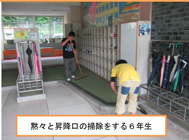
黙々と昇降口の掃除をする6年生