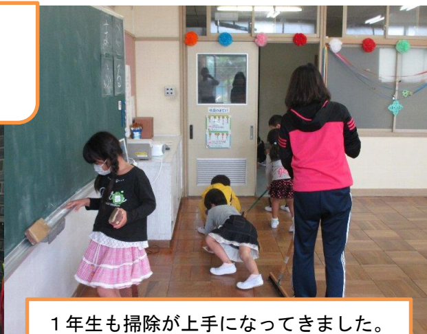
1年生も掃除が上手になってきました。