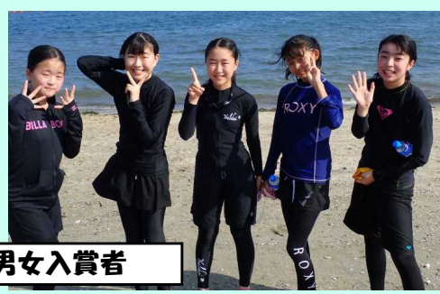
遠泳大会の男女入賞者