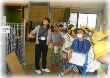
お土産ありがとうございました

12日(金)3年生がプラスチック団地の工場見学として三晃物産株式会社を見学しました。設備のしくみを学びながら、身近なプラスチック製品が製造される様子が驚いていました。