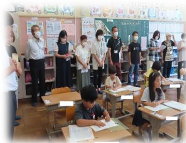
各教室で授業参観

7月4日(木)に主任児童委員・民生児童委員の皆様にご来校いただき、授業参観と情報交換会を開きました。児童の姿に、目を細めていただきました。