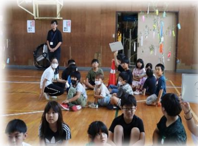
各班で願い事を紹介