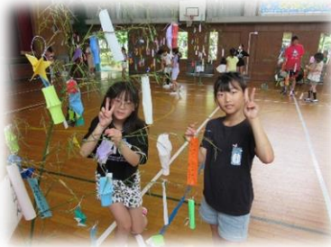
ささ飾りのできあがり