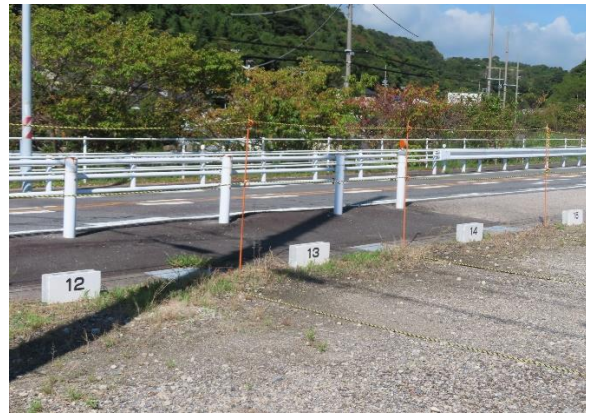
プール西側石橋組日貸し駐車場