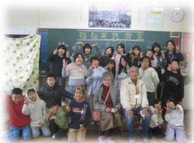
視覚障がいについて学ぶ