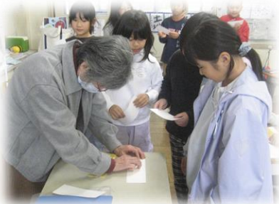
点字にチャレンジ