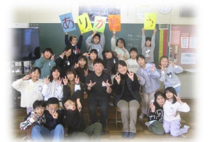
たくましく生きる力

*3年生の「左義長のぼり」のお披露目となる左義長まつりは、1月26日(日)開催です。詳細は、別にご案内いたします。