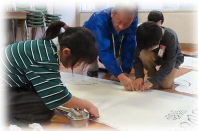
のぼりづくり開始

11月より、地域の先生や関係機関のご協力で、子どもたちの視野が広がるさまざまな活動を行っています。今回は、3年生総合学習の「左義長のぼりづくり」と4年生福祉実践教室（点字体験・聴覚障がいの方との触れ合い）の様子を紹介します。