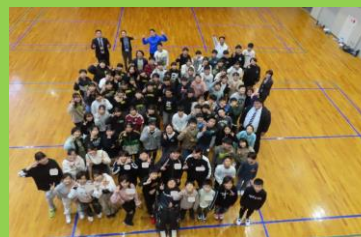
町内6年生の集合写真