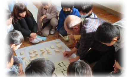
歴史と伝統を学ぶ