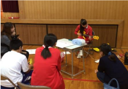
良い音色を響かせて♪

11月14日(火)に「自由の活動」の発表会がありました。3年間の集大成として、バラエティ溢れる、見事な発表会となりました。見たい発表がたくさんあって、迷っている人もいました。最後の自由の活動はとて面白い経験と思いのひとつになったと思えます。