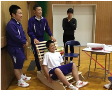
誰が乗っても大丈夫!