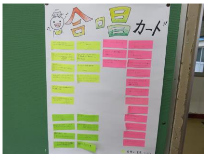
【パートごとに意見を記入】