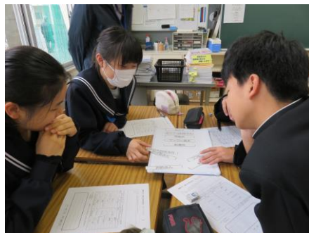
【なぜそうしたかの理由をまとめる】