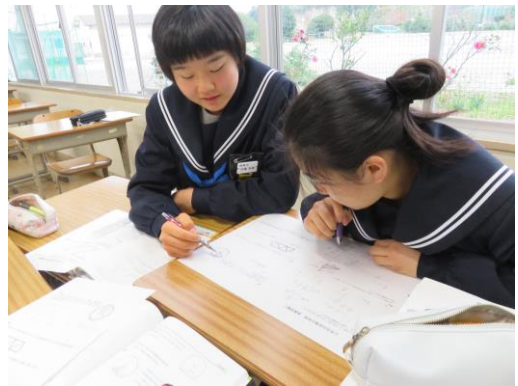
【発展問題を教え合う姿～数学科の授業より～】

最近では毎日の授業はもちろん、授業後に教科担任のところ質問にいたり、昼休みに数学等の補習を行ったりと、多くの生徒が自分の志望校に向けてより一層の努力に励んでいます。3年生全員が、自分の志望校合格という目標を達成させられるように、教員一同全力でサポートしていきたいと思えます。