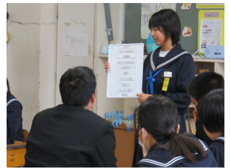
【班でのまとめを全体に伝える】