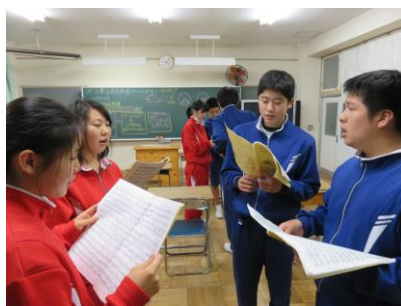
【ミニ合唱団で練習する姿】