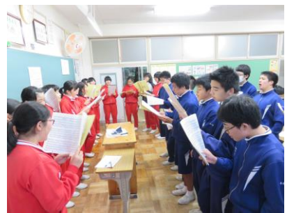
【まとまってきた3A合唱】