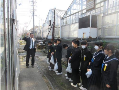
半田農業高等学校で園芸用ハウスを見学

11月8日(木)に進路校外学習に行ってきました。午前中は、普通科コースの生徒は武豊高等学校へ、専門学科コースの生徒は半田農業高等学校へ見学に行きました。それぞれの高校では、高校卒業後の進路の話の聞いたり、高校の授業をみせていただいたりする中で、もっと先の未来を見据えた進路選択の大切さを学びました。