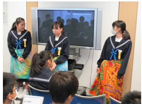
JICAでソロモン諸島の民族衣装を試着

なお、今回の進路校外学習にかかったバス代と昼食代を毎月の学年費と併せて引き落とさせていただきます。従って、12月の引き落とし額は以下になりますので、よろしくお願いたします。