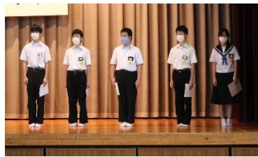
前期生徒会役員のメンバー

臨時休校のため、延期となっていた生徒会役員選挙立会演説会を5/20に行うことができました。立候補者の「師崎中学校をよくしたい」という熱い思いが伝わる演説会でした。以下のように生徒会役員が選出されました。併せて、級長、委員長も決定しましたので、報告します。