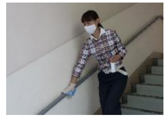
ドアノブや手すりは消毒します