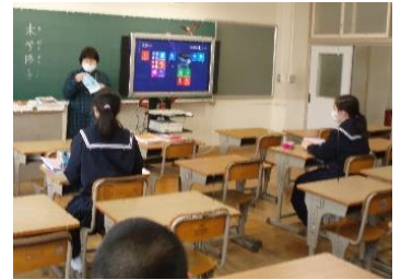
分散登校での授業の様子（机間は2m空けて）