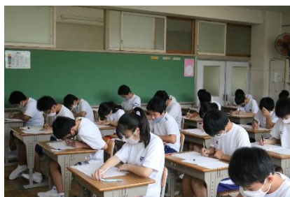
最後の1問まで諦めない

今年度最初の定期テストとなった今回の期末テストですが、一人ひとりの変化が見える結果となりました。今回は、テストの前から「自分なりに頑張った」「いつもより勉強した」という声が多く挙がっていました。家庭での勉強時間が増えたり、自習・質問タイムを効果的に活用したりと、昨年度よりも意欲的に取り組めていました。時間をかけ、たくさんの問題をこなした人は、しっかりと結果に表れています。今回納得のいく結果ではなかった人は、原因を見つけるところから始めましょう。勉強時間や勉強のやり方、授業の受け方など、原因は様々です。2学期が始まる前に対策をしておきましょう。次のテストでは自信を持って臨めるように、今回できなかった問題を見直し、1学期の学習内容をしっかり身に付けておきましょう。