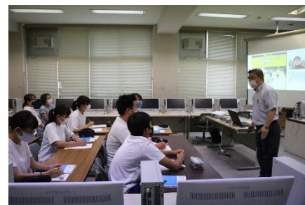
真剣に話を聞いていました