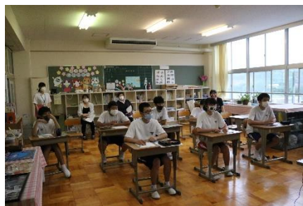
貴重な機会を大切に