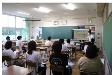
保護者の方も多く参加

17日(金) 期末テスト終了後、知多半島内の公立高校と私立高校の先生方をお招きして、進学説明会を行いました。今回は受験生としての参加ということで、とても意欲的に話を聞き、しっかりとメモをとっている生徒が多く見られました。高校選びで悩んでしまうこの時期に、高校の先生から直接話を聞ける機会は多くありません。今後、各学校の見学会、説明会等も予定されているので、積極的に参加して、進路選択に役立てていきましょう。