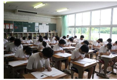
これまでの努力を発揮