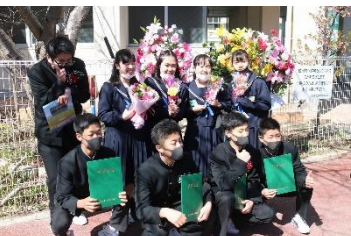
正門前で記念撮影