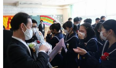
担任との涙の別れ