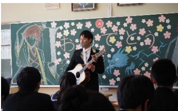
担任から歌のプレゼント