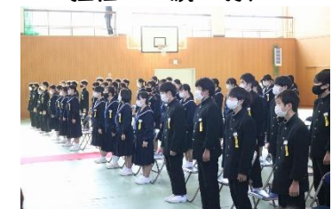
在校生の態度も立派