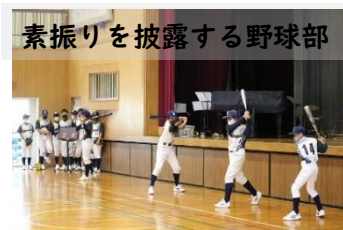
素振りを披露する野球部