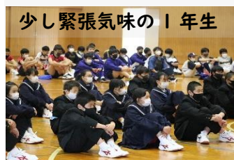
少し緊張気味の1年生

新1年生も入学式から10日経ち、中学校生活に慣れ始めた19日(月)に、生徒会主催の新入生歓迎会が開かれました。生徒会役員が作成した学校行事紹介や先生紹介の動画を視聴した後、部活動紹介では、先輩が工夫を凝らしたパフォーマンスを交えながら発表してくれました。練習の様子を実演したり、部長を中心に活動内容を説明したりしながら、和やかな雰囲気で行われました。例年であれば、全員でレクをして楽しみますが、今年はコロナウイルス感染防止の観点で控えめました。しかし、1年生の楽しそうな笑顔が随所に見られ有意義な会となりました。20日からは部活動見学、翌週には体験を行い、仮入部がスタートします。本入部は夏休みになってからとなりますが、部活動も中学校生活では重要な活動ですので、しっかり考えて決めてもらいたいものです。