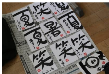
生徒の書いた字手紙