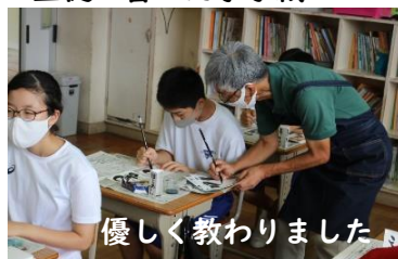
優しく教わりました