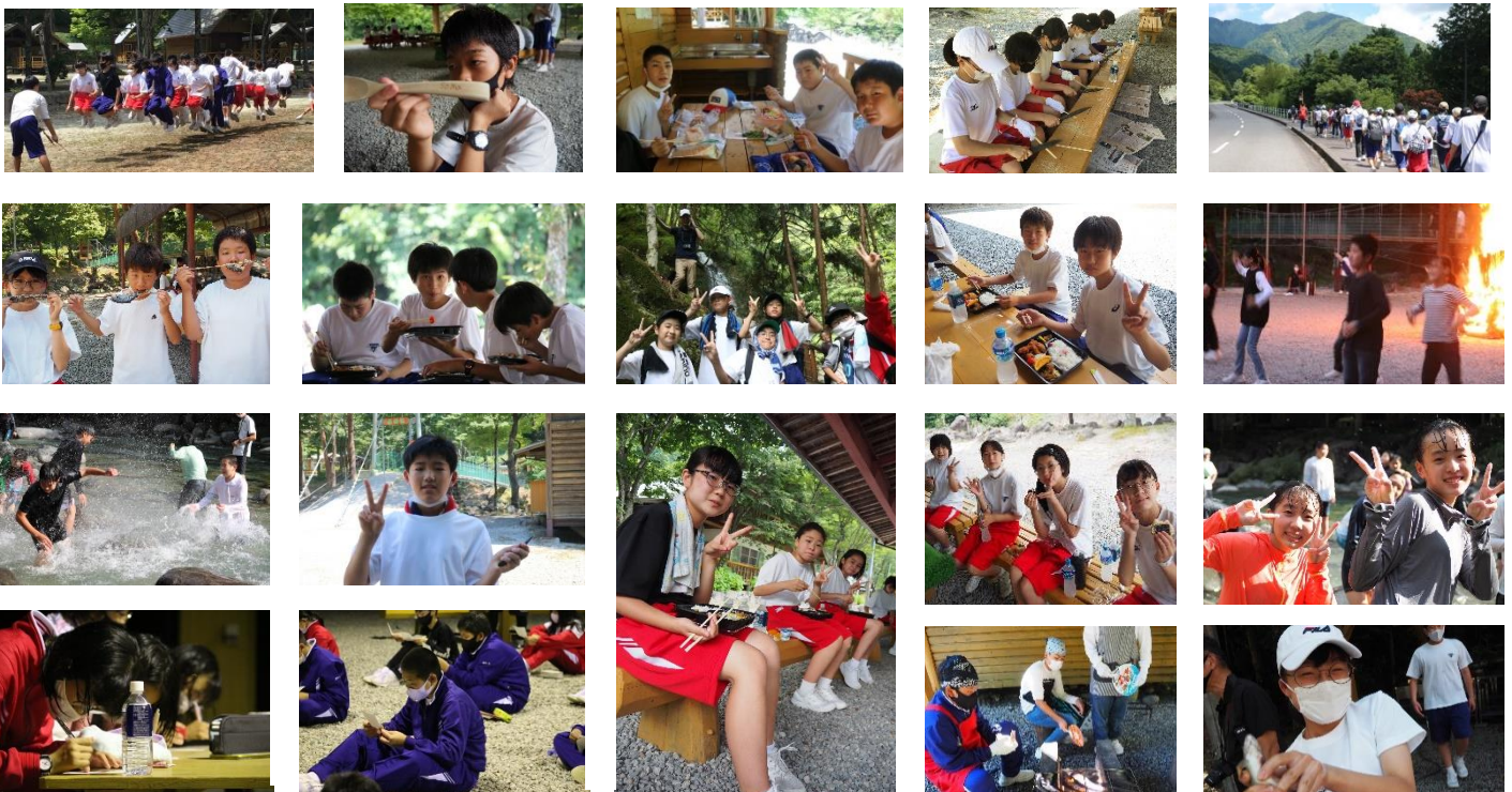
林間学校の様子 (学校祭で注文できます)