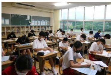
サマースクールの様子

今年度も夏季休業中に前半3日間、後半5日間のサマースクール(自主学習)を開催しました。毎回50人以上の生徒が参加し、1時間程度学習に取り組むことができました。どの教室も「シーン」と落ち着いた雰囲気の中で集中して学習に向かう姿勢が見られ、参加した生徒にとって大変有意義な時間となりました。多くの生徒が学習への意欲を見せてくれたことを大変嬉しく思います。