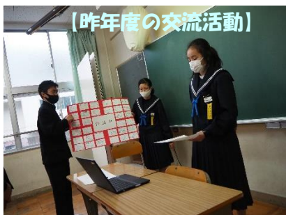
【昨年度の交流活動】

3/15(水)の交流会が統合前、最後の活動となります。交流会の詳細は、先週末に案内させていただきました。お忙しいかと思いますが、午後から行われる授業参観や進路説明会にぜひご参加いただけたらと思います。