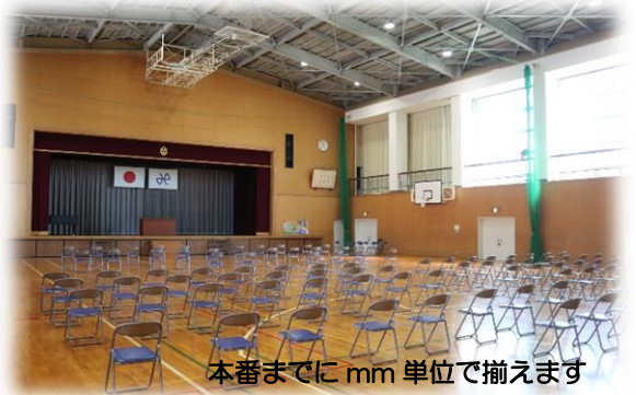
本番までにmm単位で揃えます