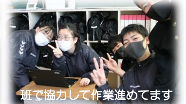
班で協力して作業進めています