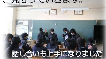
話し合いも上手になりました

今週は3年生を送る会、来週は卒業式と、2年間学校行事や部活動でお世話になった先輩とのお別れの時が近づいてきました。3年生を送る会に向けて、先輩たちに楽しんでもらいながら感謝の気持ちが伝わるよう、クラス全員で計画的に準備を進めています。また、昨日は卒業式の会場づくりを行いました。先輩方が気持ちよく師崎中を卒業できるよう、当日までしっかりと準備を進めます。と同時に、みなさんの卒業まで残り1年です。1日1日を大切に過ごしたいですね☺