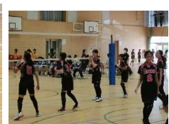
バレーボール女子