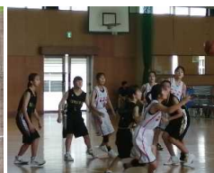
バスケットボール女子