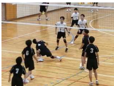
バレーボール男子