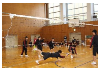
フライングレシーブ？