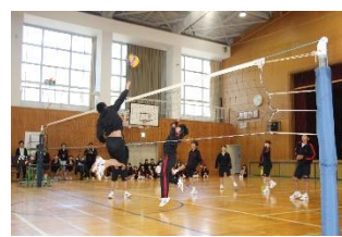
エースのアタック？