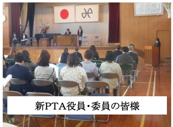
新PTA役員・委員の皆様

PTA総会では、無事に令和8年度内海小学校PTA活動をスタートさせることができました。令和7年度のPTA役員・委員の皆様、1年間PTA活動にご尽力いただき、ありがとうございます。新PTA役員・委員の皆様、内海小学校のためによりしくお願いいたします。また、保護者の皆様におかれましては、PTA活動にご理解いただき、ご協力をよろしくお願いいたします。